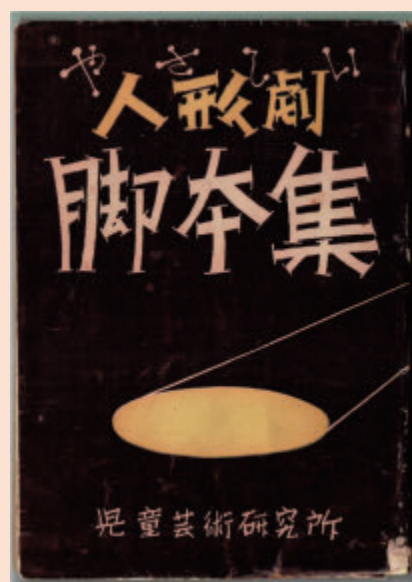
やさしい人形劇脚本集 / 人形劇「仲よし」掲載 仲よし / 三木信一脚本 児童芸術研究所 1950

お問い合わせ： 神奈川大学 非文字資料研究センター 〒221-8686 横浜市神奈川区六角橋 3-27-1 TEL： 045-481-5661 (内線 3533) E-mail： himoji-symposium@kanagawa-u.ac.jp